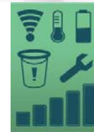
NEU in 2017: LCD-Handgriff