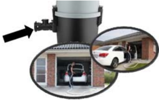
NEU in 2017: Direkt-Saugdose