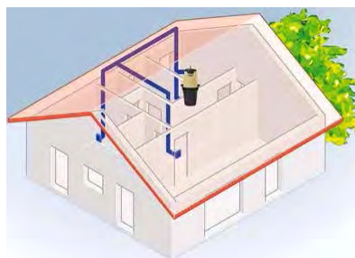
Die neuen APOLLO Zentralsauger der Generation 3.0