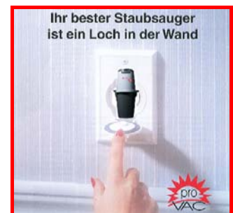
Ihr bester Staubsauger ist ein Loch in der Wand