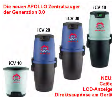
NEU: Cat5e LCD-Anzeige Direktsaugdose am Gerät