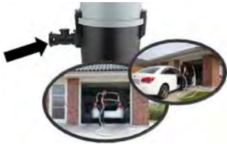
NEU in 2017: Direkt-Saugdose