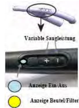
NEU in 2017: APOLLO 3 Funk Ein/Ausschalter Saugleistung regelbar + / - Service-Blinker