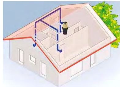
Die neuen APOLLO Zentralsauger der Generation 3.0