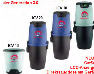
NEU: Cat5e LCD-Anzeige Direktsaugdose am Gerät